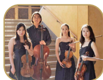
カルテット・アマビレ (室内楽)