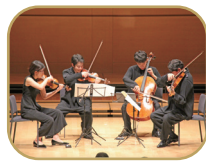
レグルス・カルテット (室内楽)

第41回音楽祭音楽監督賞 2021年バルトーク国際コンクール優勝 2022年ミュンヘン国際音楽コンクール第2位