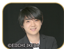
藤田 真央 (ピアノ)