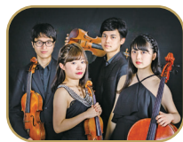
カルテット・インテグラ (室内楽)

第41回音楽祭音楽監督賞 2021年バルトーク国際コンクール優勝 2022年ミュンヘン国際音楽コンクール第2位